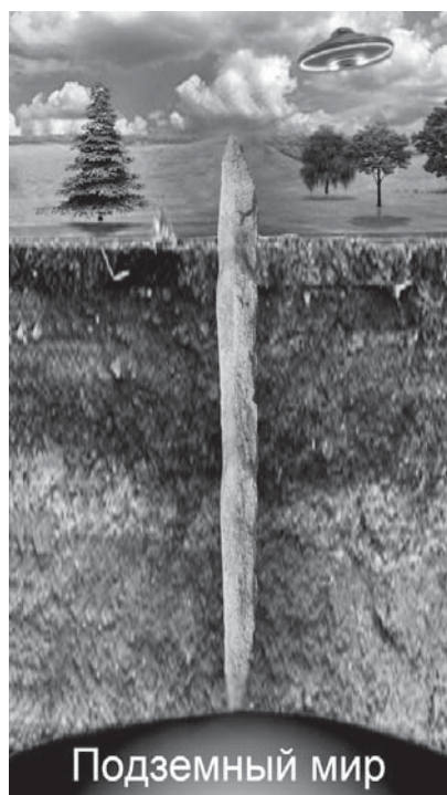
Возможно менгиры растут из подземного мира

— Такая сила, мне кажется, и в самом деле существует. В противном случае нельзя было бы объяснить многие феномены, связанные с камнем; ну.. хотя бы то, что жизнь каменных существ кто-то остановил и что они находятся сейчас в неактивном состоянии и не конфликтуют между собой. На Востоке эту силу называют Каменной Си-