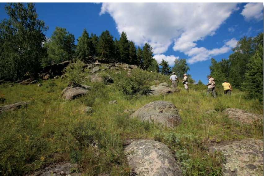
Почему эта горка называлась злобной?