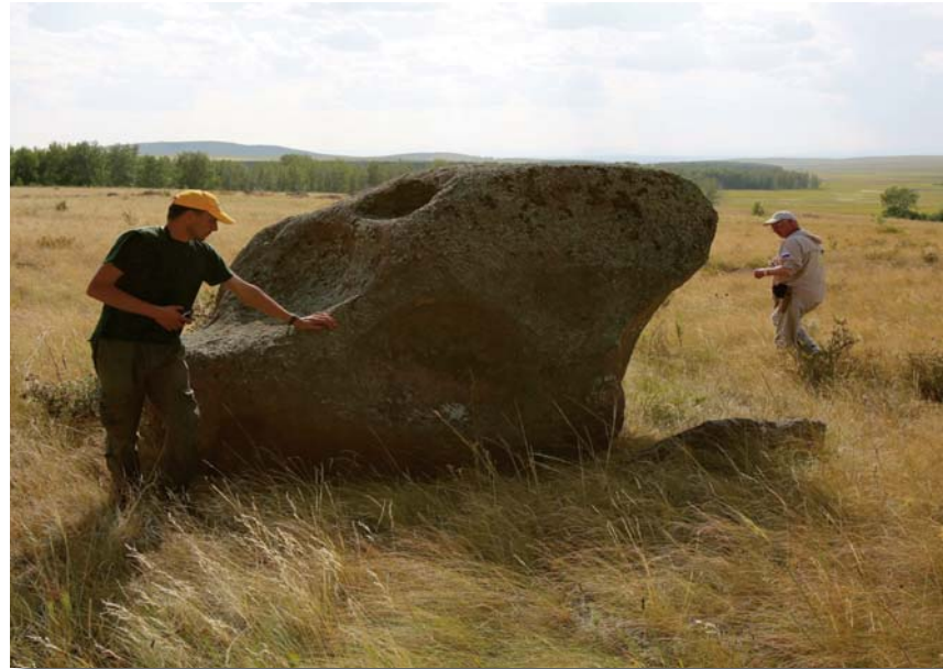
«Помеченный каменный человек»

— Как бы фантастически это не звучало, помеченные «каменные люди» должны в недалеком будущем ожить. И