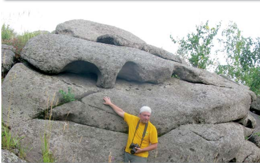
Неужели когда-то шла «каменная война»?