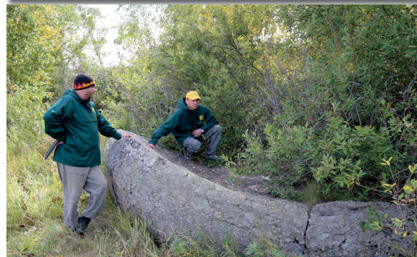
Полушаровидные «каменные люди»

— Что Вы понимаете под выражением «каменная жизнь»?