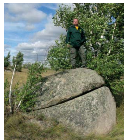
Возможно, это тоже каменные люди