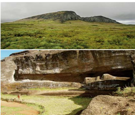
Вулкан Рану-Рараку - карьер для изготовления истуканов о. Пасхи

— Сказки Бажова «Каменный цветок», «Малахитовая шкатулка», «Хозяйка медной горы» и другие тоже, ведь, изошли из Урала. Не связано ли это с каменной жизнью, о которой Вы говорите?