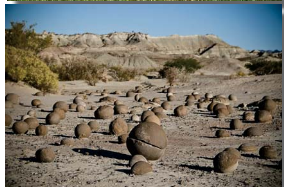
Каменные шары Коста-Рики и Аргентины

находят в разных местах земного шара (Кавказ, Европа, и др.), но, вполне возможно, они могли зародиться именно на плато Устырт. Нужны новые исследования.