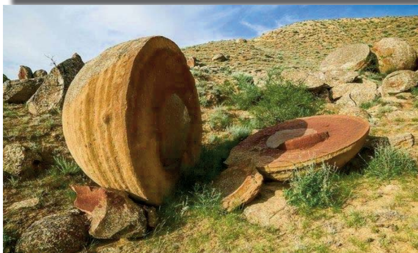
Неужели такие «каменные люди» вылупились из «каменных яиц» на плато Устырт и дошли до Урала?

метре). Кстати, расстояние от горы Ямантау до центра плато Устырт 999 км, а от г. Ямантау до г. Магнитной — 99 км.