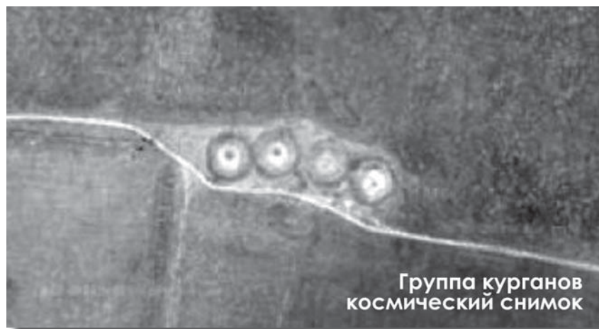
Группа курганов космический снимок

появляется фонтан из камней и земли, которые образуют вал вокруг отверстия. Оттуда вылетает существо с крыльями и красными глазами. Вскоре это существо, называемое птице-человеком, уходит под землю, засосав часть грунта и создав пробку.