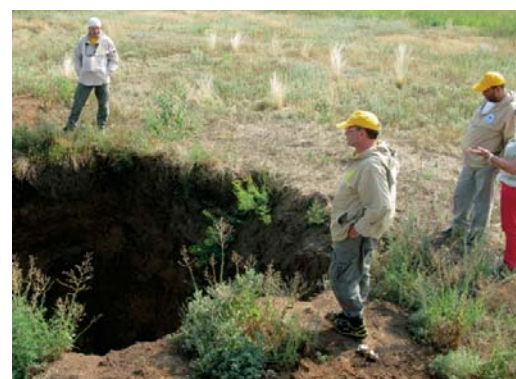
Здесь были «черные копатели»