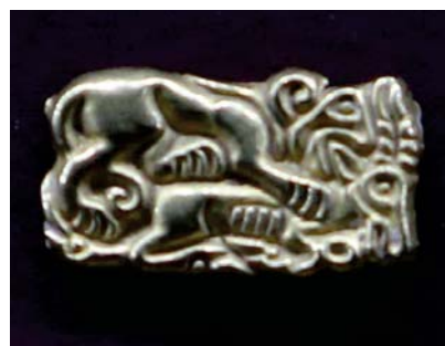
Золотые украшения, найденные в воронке курганов

— И их можно понять, потому что в воронке кургана (а каждый курган имеет воронку, ведущую к пробке!) нередко находят кости людей, гробы, утварь и золотые украшения. Вот только одного не учитывают археологи — как могли древние люди, пользуясь лопатами, насыпать курганы, достигающие порой диаметра 200 метров и высоты 10 метров?! Это трудно