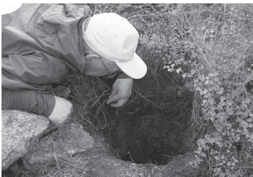
Неожиданно появившееся круглое отверстие в земле. Алтай 2006 г.