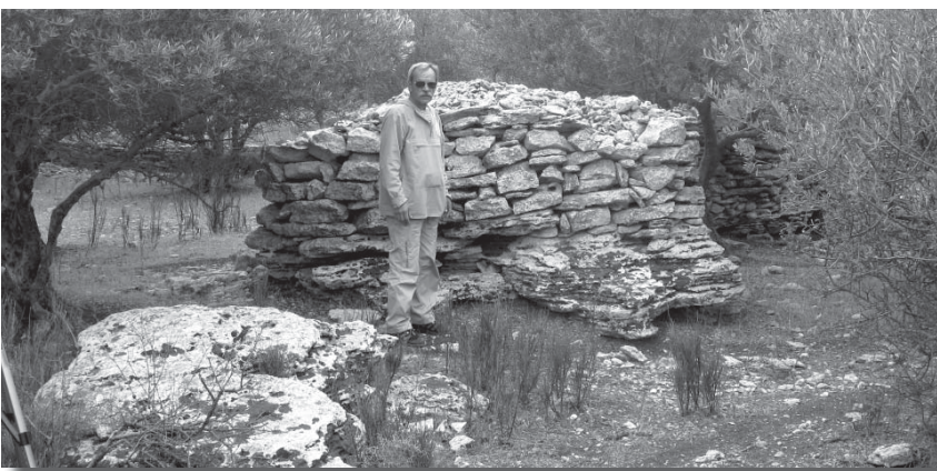
«Куриный домик», закрывающий проход под землю. О. Крит, 2008 г.

размера. Да сложена так аккуратно, что сделать это без применения специальной техники было бы невозможно. Причем, эти камни не поросли мхом и выглядели столь свежими, что будто бы пирамидку сложили вчера. Однако, вокруг мы не нашли места, откуда бы извлекались камни. Не было ни одной тропинки, по которой носили бы камни и сюда приходили бы люди. Даже трава была не примята. Было такое ощущение, что пирамидка сама прилетела сюда. Находиться рядом с пирамидкой было приятно, но чувствовалась какая-то чужеродная энергия.