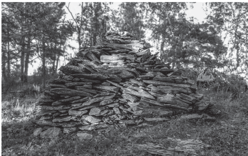
Блуждающая пирамидка на хребте Узунгур (Башкирия)