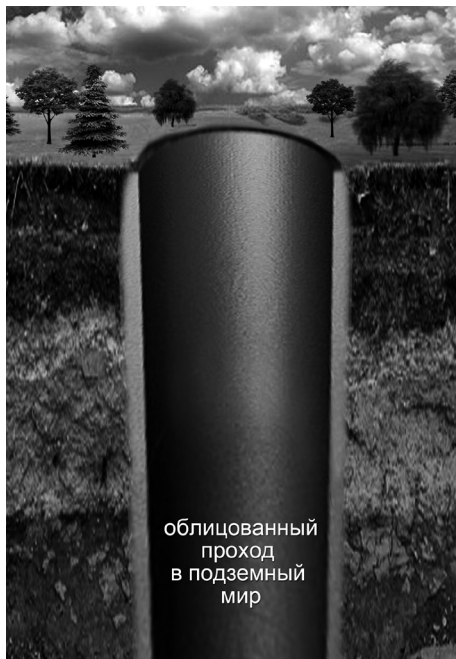
облицованный проход в подземный мир