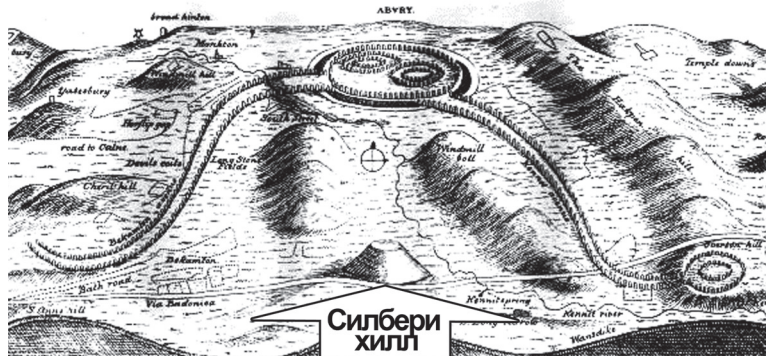
Схема монументов Эйвбери и Силбери, сделанная в 1650 году

- Если следовать Вашей логике, то получается, что на территории современной Англии некогда созидалась жизнь с помощью трех колец Эльфов?