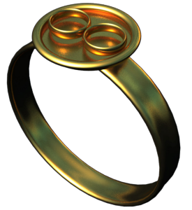
Так могло выглядеть Главное Кольцо Власти Саурона

В то время как схема, где внутри большого кольца рядом